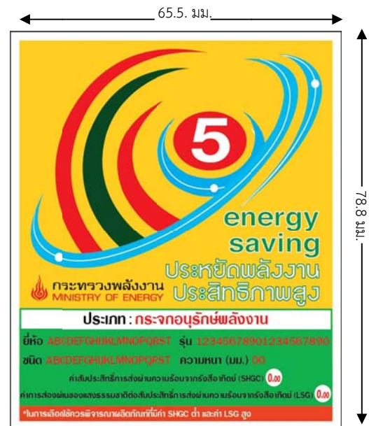
ตัวอย่าง ฉลากประหยัดพลังงานประสิทธิภาพสูง สำหรับ กระจกอนุรักษ์พลังงาน

โดย ตัวเลขค่าประสิทธิภาพจะเปลี่ยนแปลงไปตามผลการทดสอบกระจกชิ้นนั้นๆ โดย ค่าประสิทธิภาพที่ระบุในฉลากประหยัดพลังงานประสิทธิภาพสูงจะแสดงเป็นทศนิยม 2 ตำแหน่ง